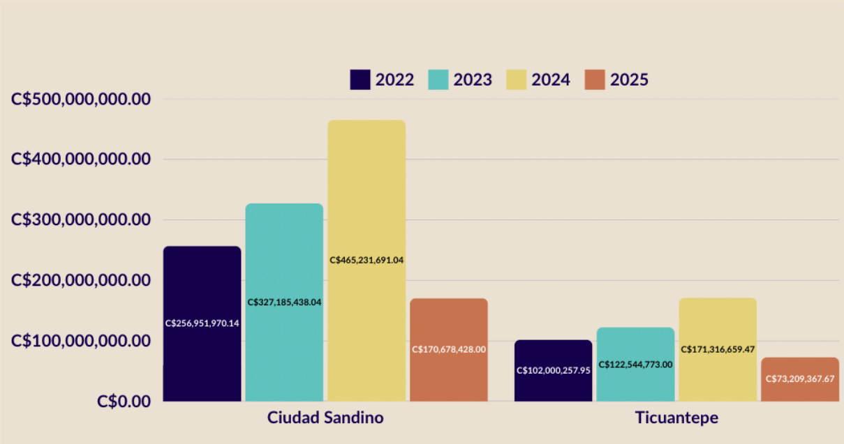
Gráfico 4. Presupuesto Ciudad Sandino y Ticuantepe 2022, 2023, 2024 y 2025.