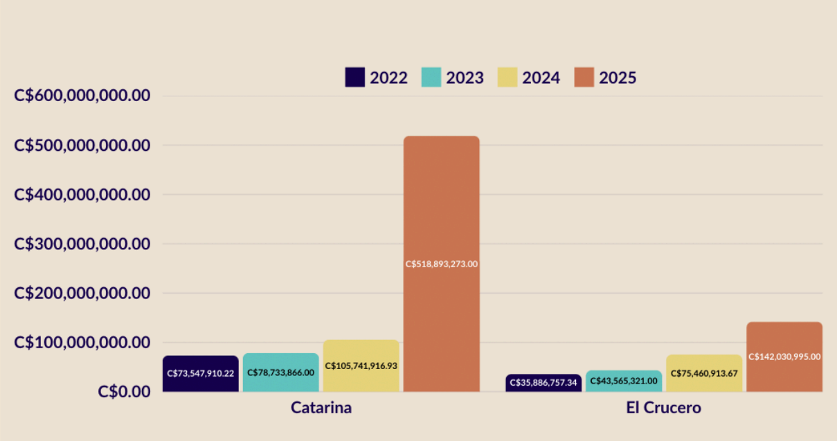
Gráfico 3. Presupuesto Catarina y El Crucero 2022, 2023, 2024 y 2025.